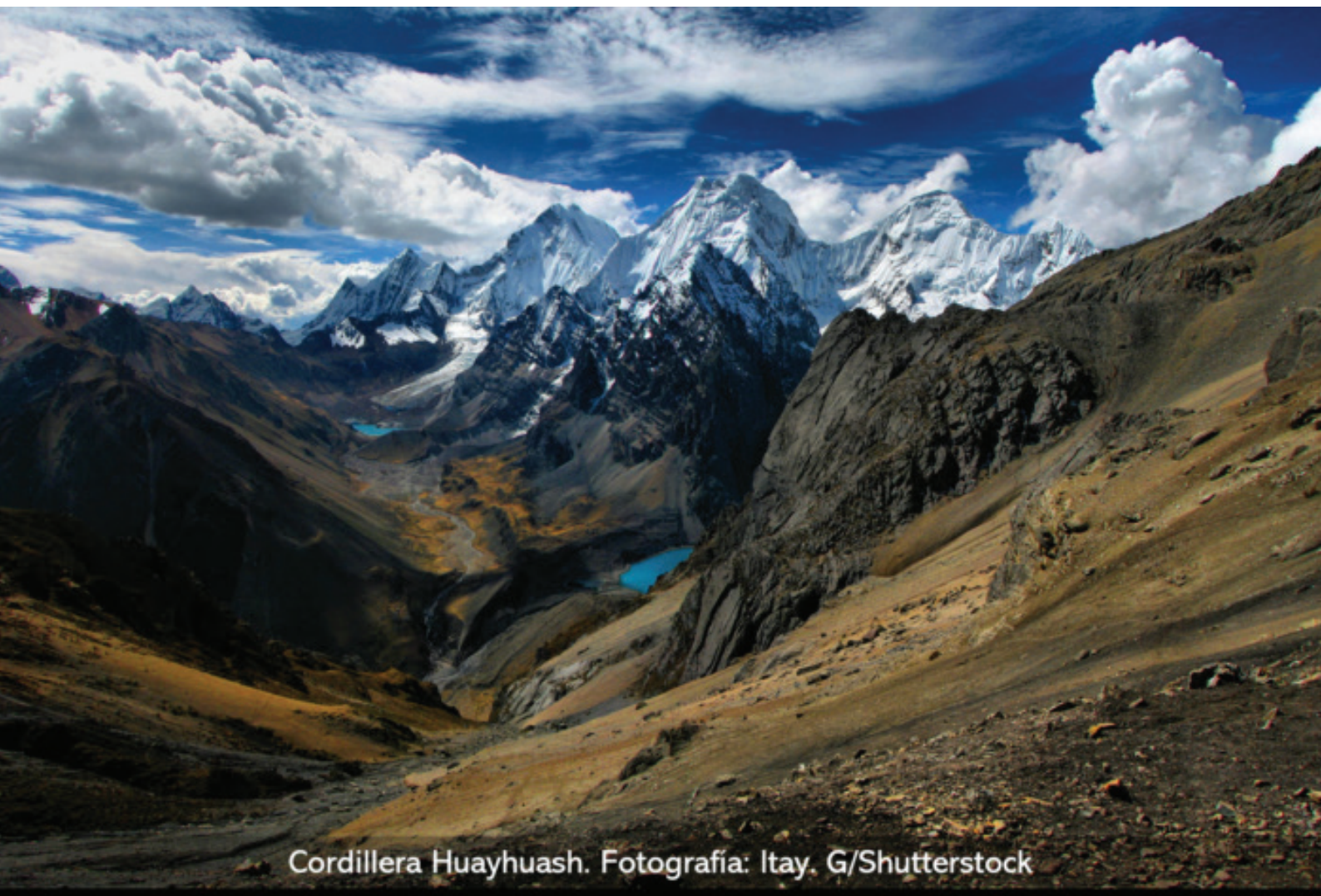
Cordillera Huayhuash.